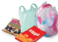
Emballages en plastiques souples