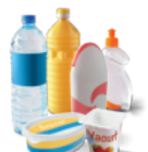
Emballages en plastiques rigides